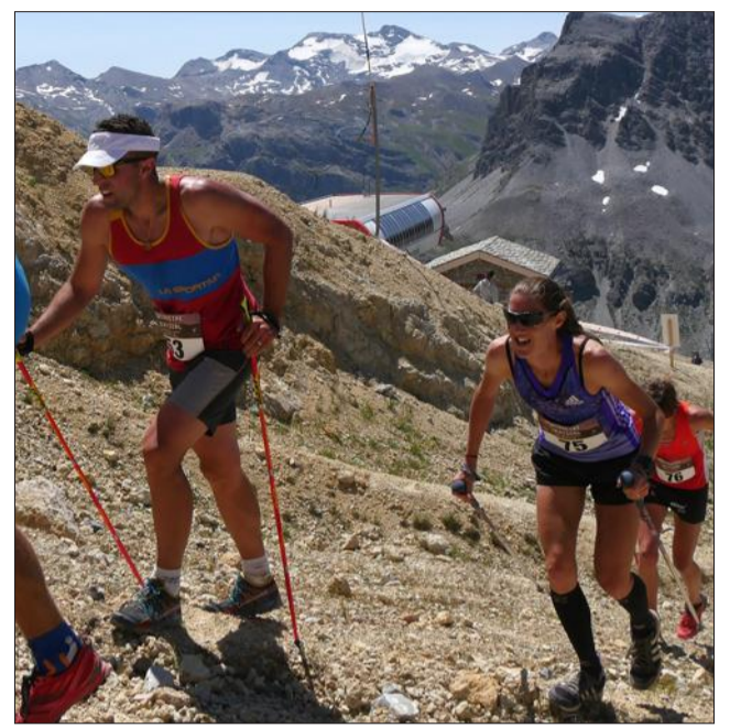
Pendant le kilomètre vertical, les efforts sont intenses.