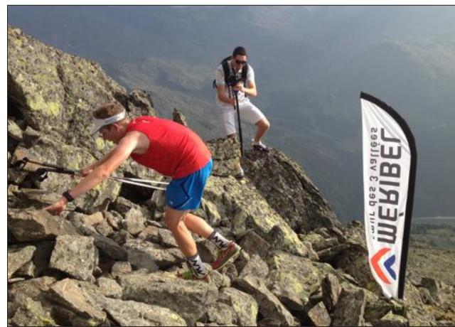
La Verticale de Méribel offre aux coureurs une pente forte et une arrivée plutôt aérienne.

L'association "Méribel sport montagne" reprendra ses activités d'été avec une première "Verticale", dimanche 10 juillet.